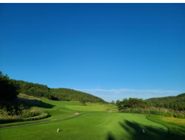
No.14ホール 緩やかな上りが続く。