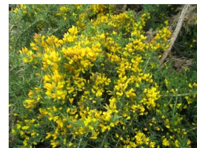
ハリエニシダ 開花時期: 5月頃～6月頃 西ヨーロッパ原産の低木。 コース内に点在している。 花言葉は『変わらぬ愛』、『不変の愛』など。