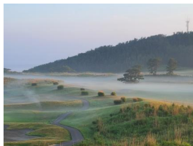
朝靄 静寂な朝の時間。 幻想的な朝靄が広がる風景。