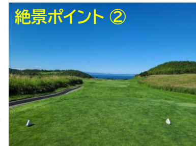
No.16ホール 夏泊で一番高い標高のティーグラウンド。 下りながら雄大な陸奥湾の絶景を楽しめる。