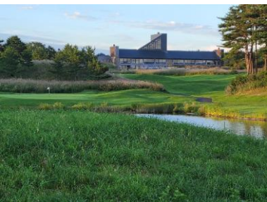
No.12ホール 池越しに見えるクラブハウスは、 隠れた撮影スポット。