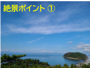
No.10ホール グリーン裏は陸奥湾と大島を臨む絶景。 ベンチもあり、撮影スポットになっている。